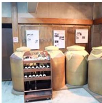
山梨県甲府研修旅行にて撮影

ただ、これからの30年は、過去30よりは、何か大きな変化が起きるような気がいたします。これからの時代に困難があっても、皆さんと一緒に突破してゆきたいと思います。